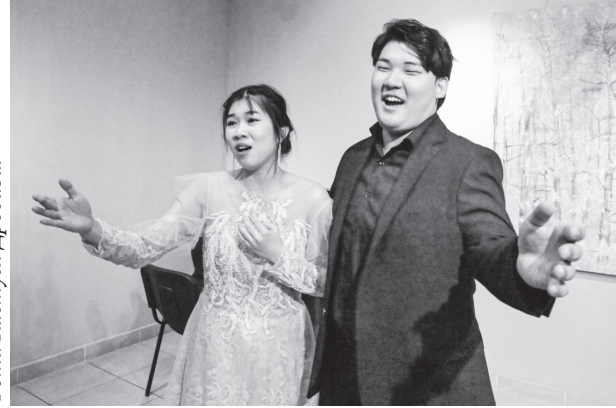
Фота Кастуся Дробава.

Імправізаную сцэну ўпрыгожвалі карціны Аляксея Хацкевіча «Максім Багдановіч. Зімовы вобраз» і Васіля